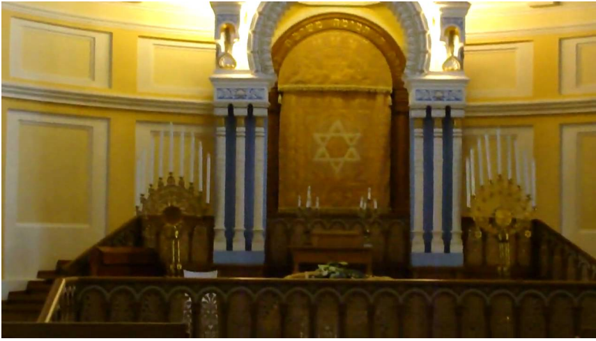
Estrela de Davi. Grand Choral Sinagog, São Petesburgo, Rússia.

A cidade de Jerusalém foi, por mais de 600 anos, a capital dos hebreus. É considerada um tesouro cultural da humanidade. Na Jerusalém atual, a parte interna das antigas muralhas é chamada de Cidade Velha, e a parte de fora é conhecida por Cidade Nova.