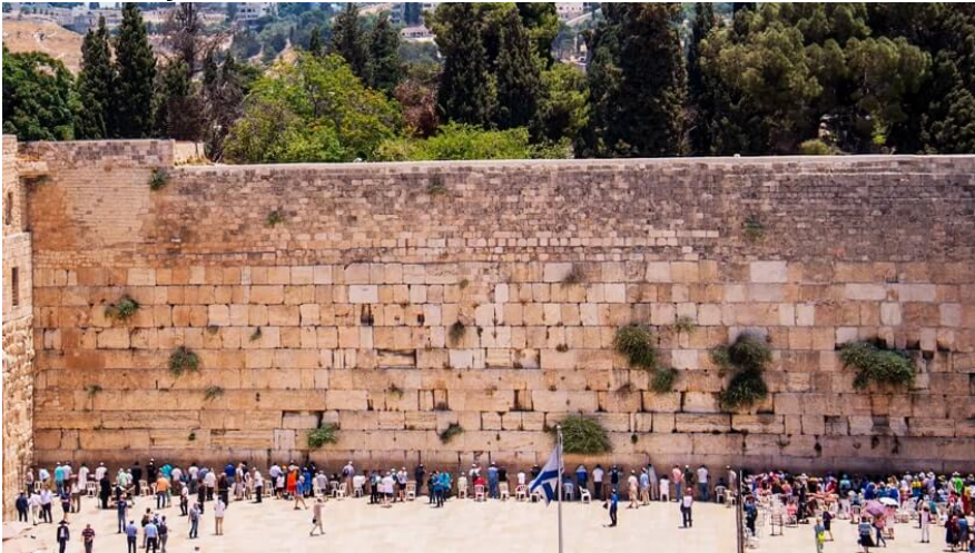
Muro das Lamentações.

O templo construído por Salomão foi destruído e saqueado pelos babilônios em 587 a.C. Foi reconstruído em 516 a.C. e durou mais de meio milênio, quando os romanos o destruíram de vez, em 70 d.C., ao expulsarem os hebreus da região. O que restou do templo de Salomão tornou-se local sagrado para os judeus e é conhecido como Muro das Lamentações .