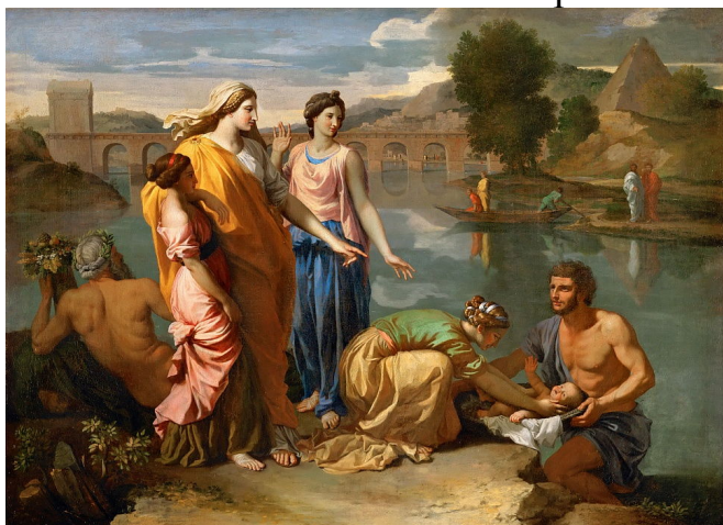
Moisés resgatado do Nilo, óleo sobre tela de Nicolas Poussin, 1638. Museu do Louvre, Paris, França.

Como Moisés se tornou um líder para os hebreus?